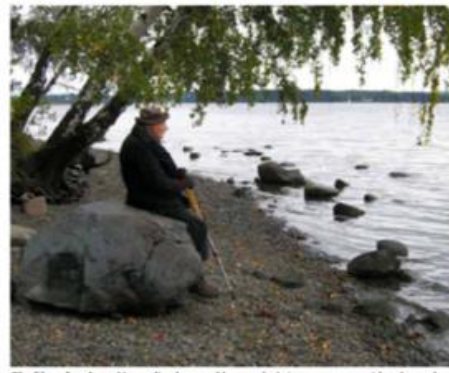
Økofilosofen Arne Næss dingler med bena på steinen som var et landemerke.

Fotoprojektet har spilt en helt avgjørende rolle for oppmerksomheten rundt prosjektet og for Bærum kommunes beslutning om å tilbakeføre steinene, en snuoperasjon som ble grundig dokumentert i NRK Østlandssendingen og Dagsrevyens Norge Rundt 30.8.16 ( https://tv.nrk.no/serie/distriktsnyheter-Bestlandssendingen/DKOA99083016/30-08-2016#t=4m11s ) og i Budstikka på nett, samt i Budstikka papir 1.9.2016 :