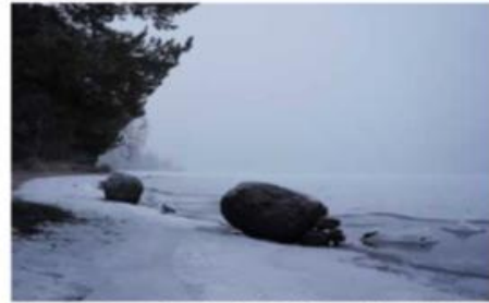
FØR. Slik har steinene på stranden på Høvikodden ligget siden siste istid.

Så snart får stranden i Bærum tilbake sine steiner. En bitte liten natur- og kulturarv skal repareres og få leve videre. Takket være at en fyr gadd å bry seg og protestere.