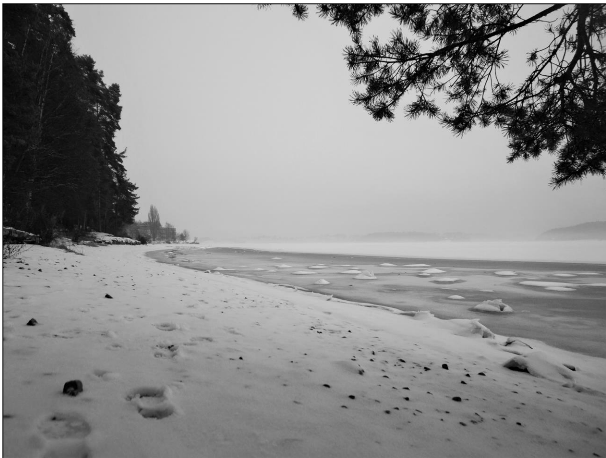
Dette er samme strand som på forsidebildet, men uten steiner, slik stranden så ut ett år, fra og med høsten 2015.

Prosjektet «Filosofisteinene» handler om rullesteiner som forsvant og stedet som mistet sitt særpreg og vant det tilbake. Det ti år lange prosjektet avsluttes med en fotoutstilling, som tematiserer fotografiets makt, enkeltmenneskets muligheter, sansingens og fantasiens potensial, heling av natur, stedets rikdom, samt landskapets myter og historier. Fotoutstillingen vil bidra til å gi stranden større verdi enn den hadde før steinene forsvant, og at vi tydeligere ser kunsten i naturen og naturen i kunsten.