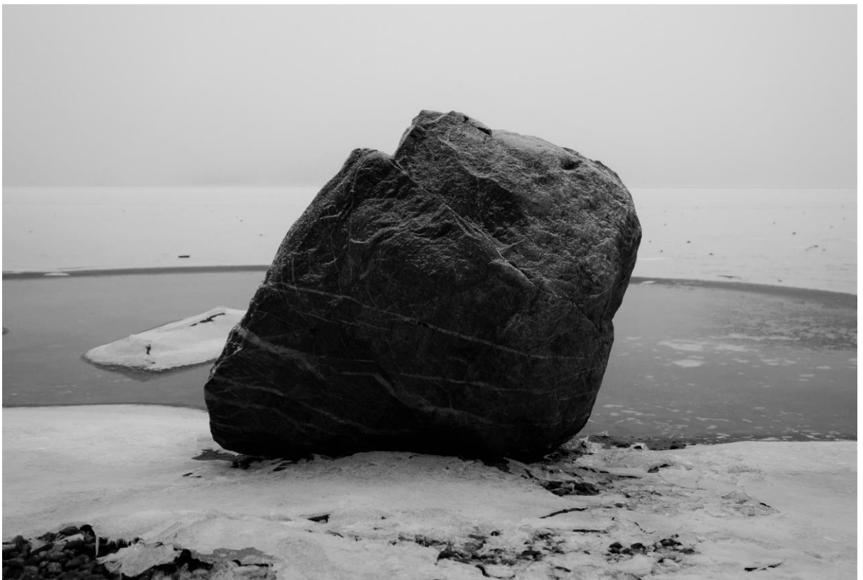
Linjer og marmorering, samklang og kontrast, som stimulerer fantasien.

Steinenes symbolske virkning vokste altså med årene. Den steinen Arne Næss hadde sittet på ble ikke bare en filosofistein, som representerte hans spesielle tenkemåte, den og de andre steinene minnet om meteoritter og utstrålte en urkraft. De symboliserte dermed ikke bare istiden, som hadde bragt dem dit, men selve Jordens historie og vår tilhørighet i Kosmos. I kontrast mot snø eller tåke, ble steinene særlig tydelige og kommuniserte vitenskap, eventyr, myter og estetikk. Gjennom hele året lokket de til seg barn så vel som voksne til lek, undring og hvile.