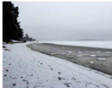
NÅ. Steinene fra siste istid er borte.